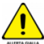
Tabella Allegato tecnico DGRT 536/2013 e 895/2013

Allerta di protezione civile - Comunicazione Codice Giallo