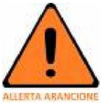
Tabella Allegato tecnico DGR 536/2013 e 895/2013